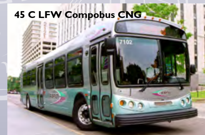
45 C LFW Compobus CNG