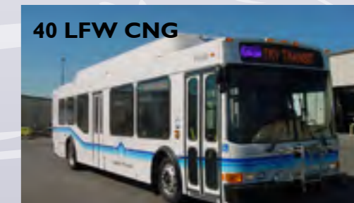
40 LFW CNG