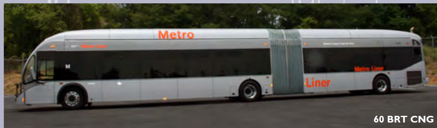
60 BRT CNG