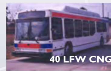
40 LFW CNG