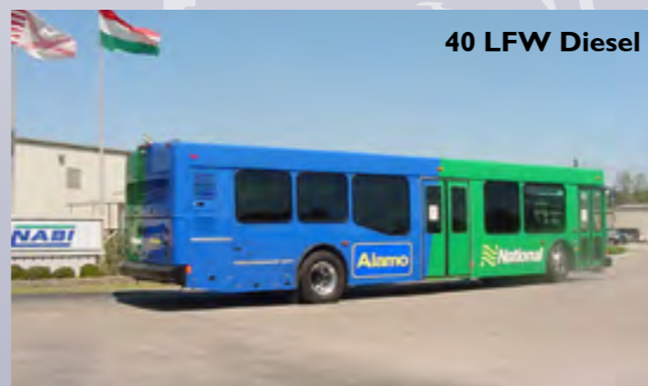
40 LFW Diesel