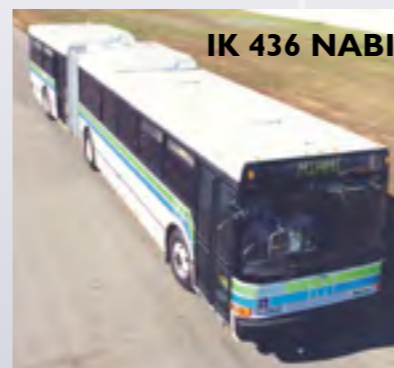
IK 436 NABI

Eddigi fennállása során a cég több mint 7500 autóbuzsot szállított ki, ebből több mint 300 a világon egyedülálló, kompozit szerkezetű autóbusz.