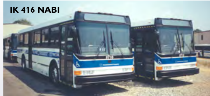
IK 416 NABI

2003-ban a Los Angeles-i közlekedési vállalat számára a NABI hazai mérnökei kifejlesztették a BRT típuscsaládot, amely a város új közlekedési rendszerének gerincét alkotja.